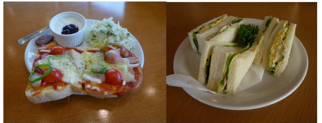
ピザトースト (野菜たっぷり)